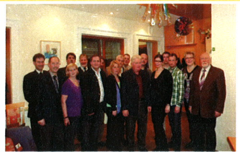
... und natürlich mit seinen Kollegen aus dem Gemeinderat