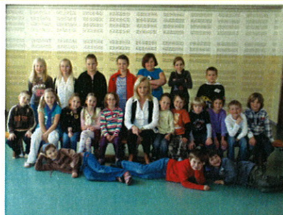
Im Turnsaal wurden Schallschutzwände aufgestellt.