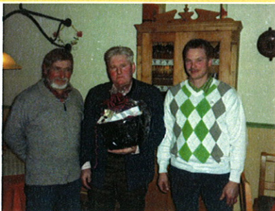
... mit dem Ortsbauernrat