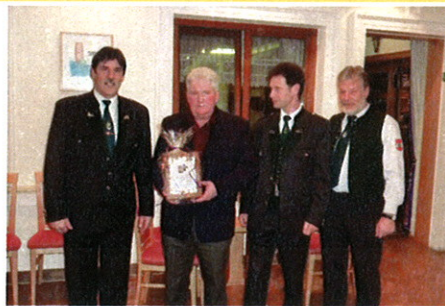
... dem Kameradschaftsbund