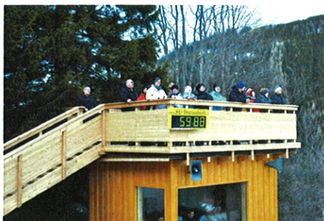
Auf der neuen Terrasse der Zielhütte lässt sich das Rennen bestens beobachten!

Wir bedanken uns bei allen Spendern recht herzlich.