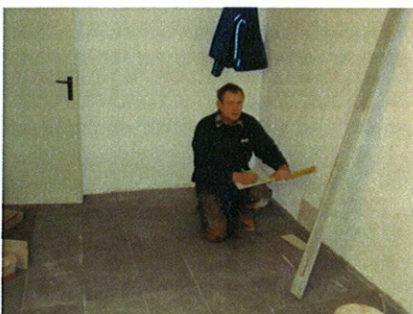
Der Gang zum Turnsaal in der Volksschule wurde verflies.