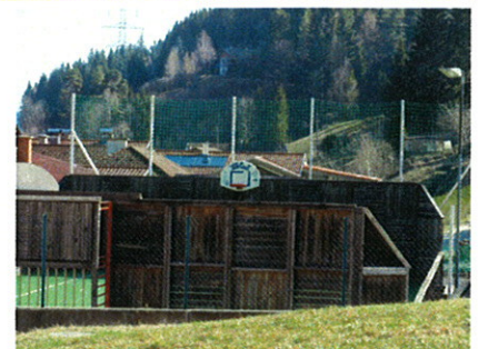
Zum Schutz der Häuser wurde ein Ballfangnetz beim FunCourt aufgestellt.