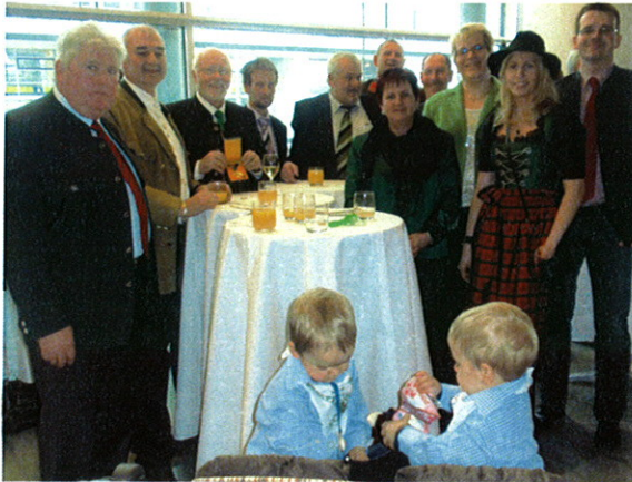
Die Familie und eine Abordnung der Gemeinde Trattenbach waren bei der Feier anwesend.